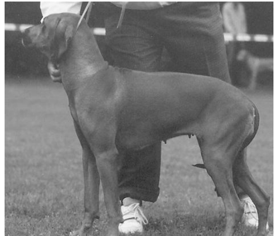
Banka de Terre Vieilles