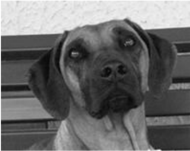
Emba de Sauvayre