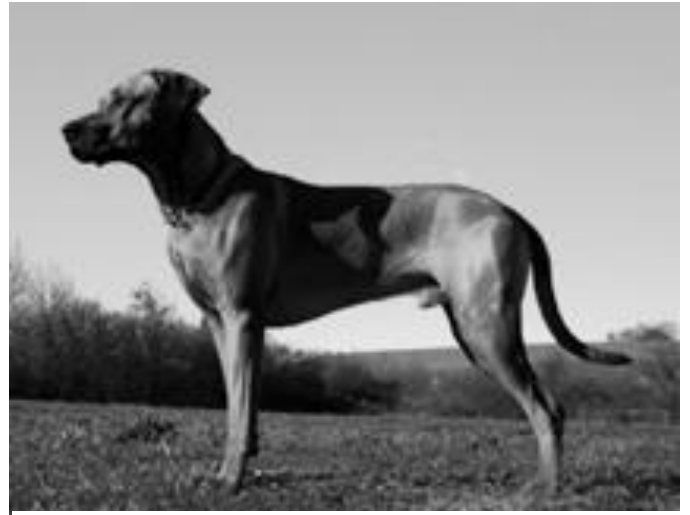
Farmers Guardian African Akono

Die zahlreichen Jahre als Züchter sowie meine langjährige Tätigkeit als Zuchtwartin haben mir erlaubt eine gewisse Erfahrung zu erlangen, aber auch mein persönliches Konzept von Ethik zu erstellen.