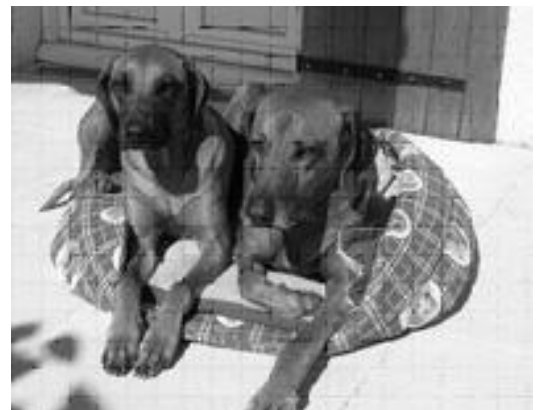
Ganda und Emba de Sauvayre